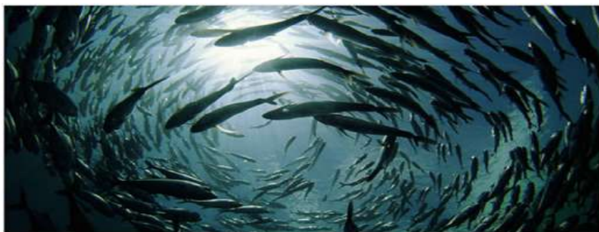
Figura 2. Procesos de auto-organización 1/

En consecuencia, se constata la universalidad, tanto de las regularidades de los fenómenos complejos, expresadas en los conceptos que se utilizan en el experimento, como de la tesis central de los estudios de la complejidad, que demuestra la existencia de cierto orden en el comportamiento caótico de los sistemas complejos. A su vez, también confirma la singularidad o carácter irrepetible de cada sistema complejo. Estos dos principios básicos tienen significados gnoseológico y metodológico extraordinarios, especialmente, en el ámbito de los estudios sobre la auto-organización y la auto-poiesis, proceso y propiedad inherentes a los seres vivos y a la sociedad humana (Gibert Galassi, 2001), aunque como se ha visto aquí la auto-organización es inherente a toda la realidad, el universo físico, sus sistemas y procesos químicos también se auto-organizan, tal como se ilustra en la siguiente imagen.